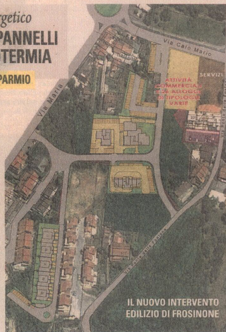
IL NUOVO INTERVENTO EDILIZIO DI FROSINONE