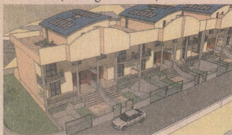
VILLE A SCHIERA - FROSINONE Via Ponte La Fontana

Isola del Liri (Via Tevere) Ceccano (Via Vigne Vecchie)