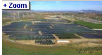
L'impianto di Montalto